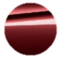
Metalik Kırmızı / Fire Red (C68)