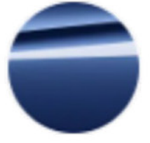
Metalik Mavi / M Portimao Blue (C31)