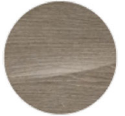
Açık Gözenekli Fineline (4H0)