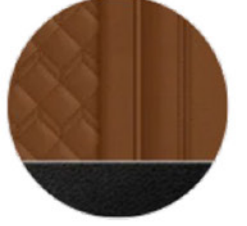
Tartufo/ BMW Individual Merino Deri (VATQ)