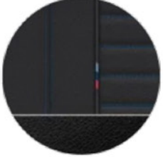
Siyah Mavi Dikişli / Vernasca Deri (MANL)