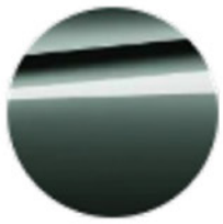
Metalik Yeşil / Cape York (C5Y)