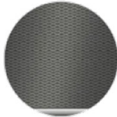
Alüminyum Rhombicle (4LN)