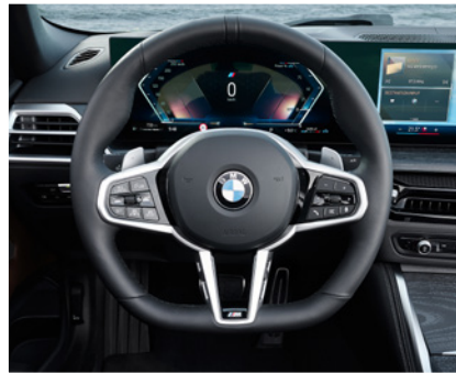
Yeniden tasarlanan düz tabana sahip sportif M Deri Direksiyon