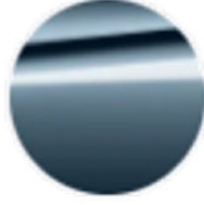
Metalik Mavi / Arctic Race (C4F)