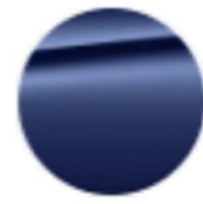
Metalik Mavi / BMW Individual Frozen Portimao Blue (X1E)