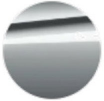
Metalik Gri / Brooklyn (C4P)