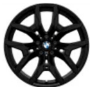
19 inç Çift Kollu Stil 995 M Jet Black