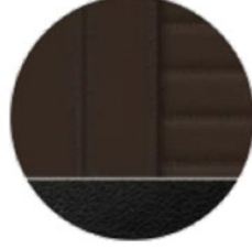
Mocha / Vernasca Deri (MAMU)