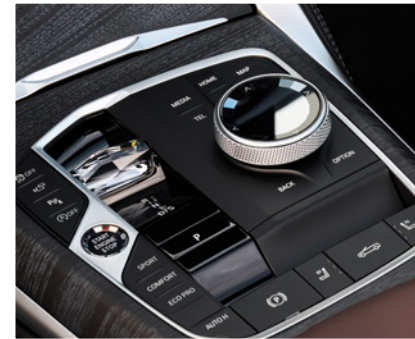
Kristal cam öğelere sahip kontrol paneli