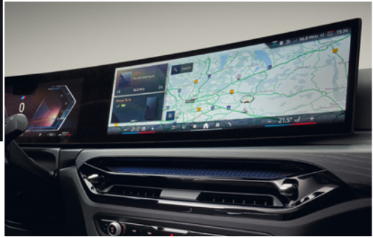
QuickSelect arayüzlü BMW İşletim Sistemi 8.5'e sahip Kavsi Ekran