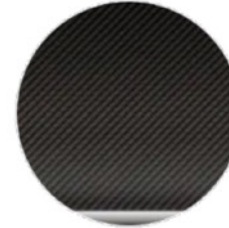
Karbon Fiber İç Kaplama (4MC)