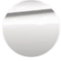
Metalik Beyaz / Mineral (A96)