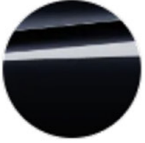
Metalik Siyah / Sapphire (475)