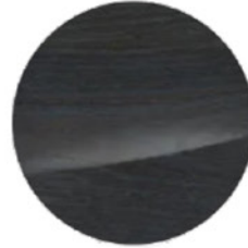
Açık Gözenekli Ahşap Kaplama (4H1)