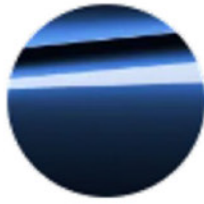
Metalik Mavi / BMW Individual Tanzanite (C3Z)