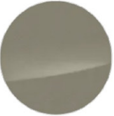
M Alüminyum İç Kaplama (43W)