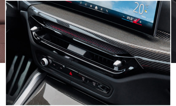
Yeniden yorumlanan klima menfez tasarımı