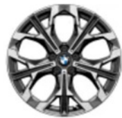
19 inç Individual Y Kollu Stil 1038 Bicolour