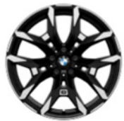
19 inç Çift Kollu Stil 995 M Bicolour