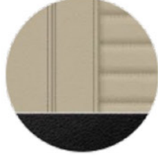
Oyster/ Vernasca Deri (MAOI)